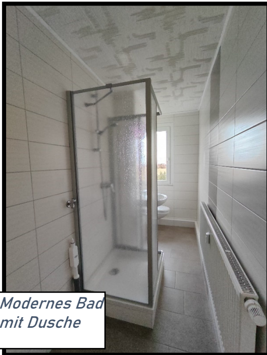
Modernes Bad mit Dusche